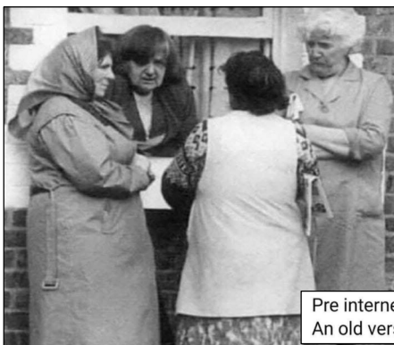
Pre internet chat room using An old version of windows...

Tijdens de eerste Corona-Lockdown (2020) kreeg ik (uw redacteur) de vraag om uit te zoeken welke program eenvoudig (lees zonder moeilijke install of aanmeldingen) kon gebruikt worden door mij moeder (toen 92 jaar) om met haar achterkleinkinderen via haar computer in verbinding te treden. Ik kwam al vlug uit bij Jitsi.