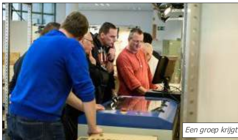
Een groep krijgt uitleg bij de lasercutter