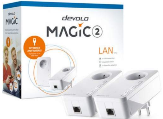
Setje powerline adapters

Hoeveel repeaters je nodig hebt, hangt af van het type internetabonnement én van je woning. "Het kan zijn dat je in je huis voldoende hebt aan twee à drie repeaters en in een appartement niet. Als er in de constructie veel ijzer zit, dan spreken we van de kooi van Faraday: het wifisignaal verliest aan kracht als het door metaal moet gaan."